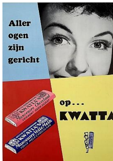
Kwatta reclame - jaren 60