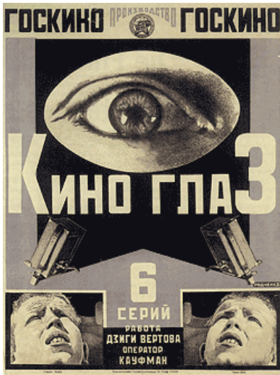
Rodchenko - filmposter jaren 20